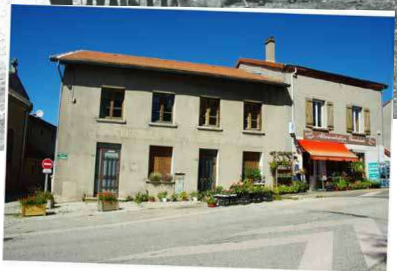
A gauche: le projet d'école de l'époque Ci-dessus: l'école à skis, au début des années 60 (certains se reconnaîtront) A droite: la Maison Matricon en 2014