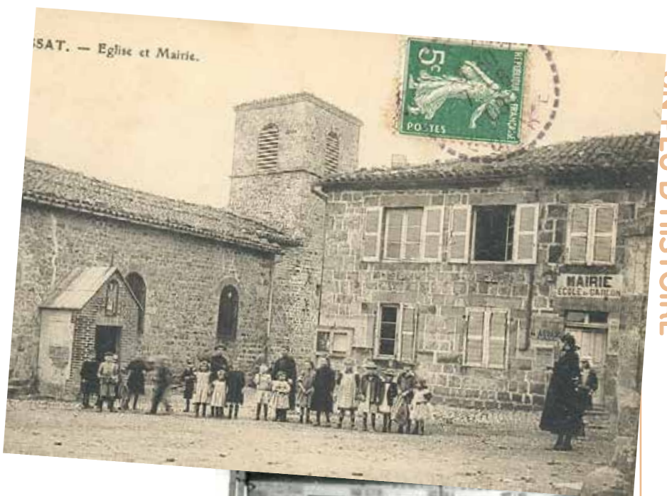
Ci-dessus: l'école au début du XX e siècle. A gauche: l'intérieur au début des années 60 A droite: la Maison Matricon en 2014