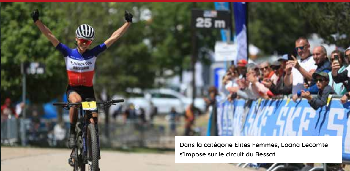
Dans la catégorie Élites Femmes, Loana Lecomte s'impose sur le circuit du Bessat