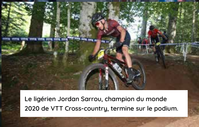
Le ligérien Jordan Sarrou, champion du monde 2020 de VTT Cross-country, termine sur le podium.