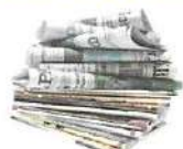
JOURNAUX ET MAGAZINES