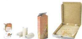
EMBALLAGES EN PAPIER ET CARTON