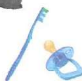
OBJETS EN PLASTIQUE